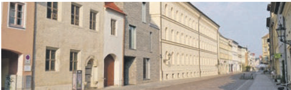
Melancthon Haus i Wittenberg

Melancthon blev ligeledes en ivrig kampfælle Luthers og overværede alle stormøder i sammenhæng med reformationen. Han systematiserede Luthers tanker og skabte derved de grundlæggende teologiske sammenfatninger, som i "Loci communes" 1521. 'Confessio Augustana', den Augsburgske bekendelse fra 1530, der den dag i dag er grundlaget for den Danske Folkekirke, er således skrevet af ham.