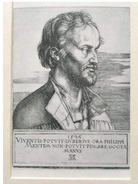
Albrecht Dürers portræt af Philipp Melancthon.

Da Kurfyrsten Frederik den Vise havde oprettet det nye universitet Leucorea i Wittenberg 1518, fik Melancthon lærestolen for græsk. Han var en ivrig lærer og lagde stor vægt på humanistisk dannelse ifølge de græske og latinske kilder. Han fik tilnavnet "Præceptor Germaniae", Tysklands lærer.